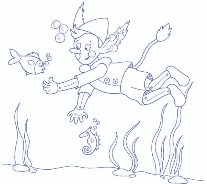
10. Pinocchio viene buttato in mare e viene mangiato da una balena. 10. Pinocchio is in the sea and a whale eats him.