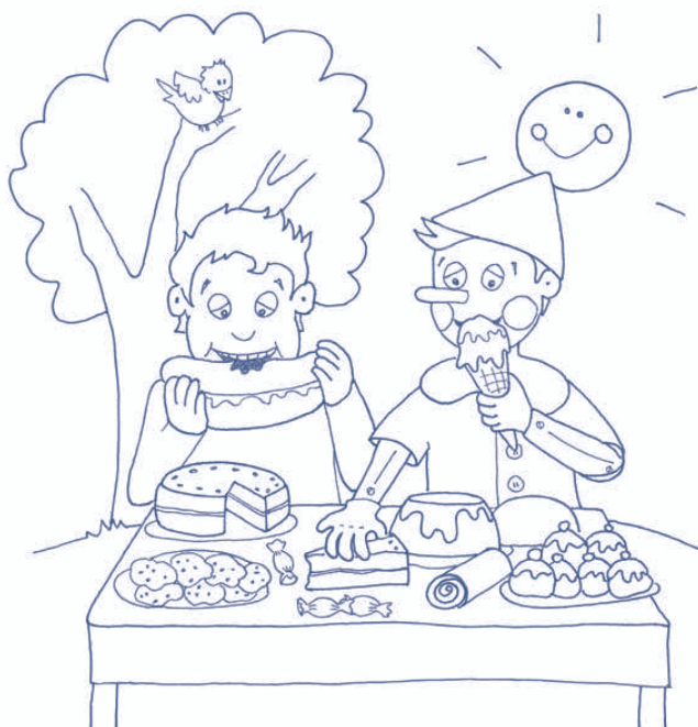
7. Pinocchio va nel Paese dei Balocchi con Lucignolo, un compagno di scuola, e mangia dolci per cinque mesi. 7. Pinocchio goes to the Paese dei Balocchi with Lucignolo and eats sweets and cakes for five months.