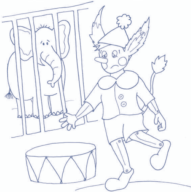
9. Pinocchio è in un circo dove lo fanno saltare e ballare. 9. Pinocchio has to jump and dance at the circus.