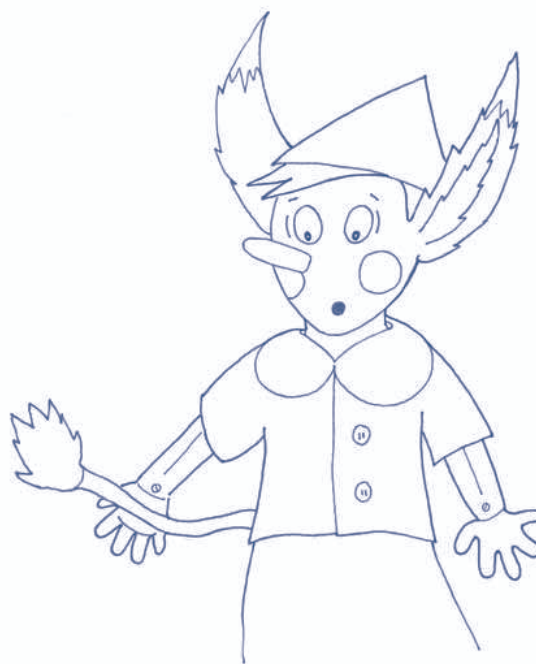
8. Pinocchio si è comportato male e gli spuntano orecchie e coda da ciuchino. 8. Pinocchio is naughty and he has donkey's ears and donkey's tail.