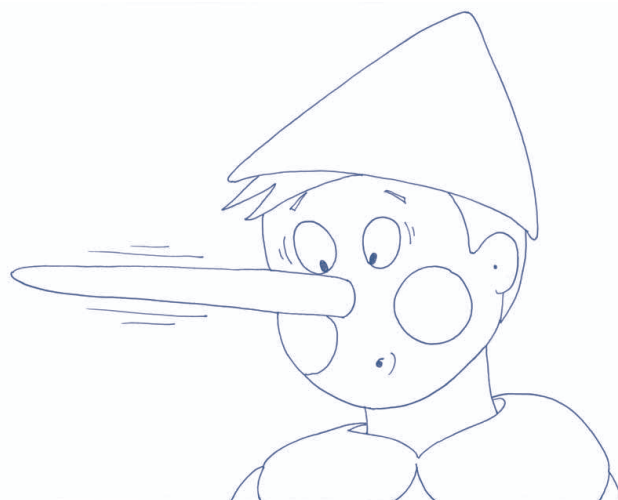
6. Pinocchio dice sempre le bugie e per questo gli cresce il naso. 6. Pinocchio tells a lie and his nose grows.