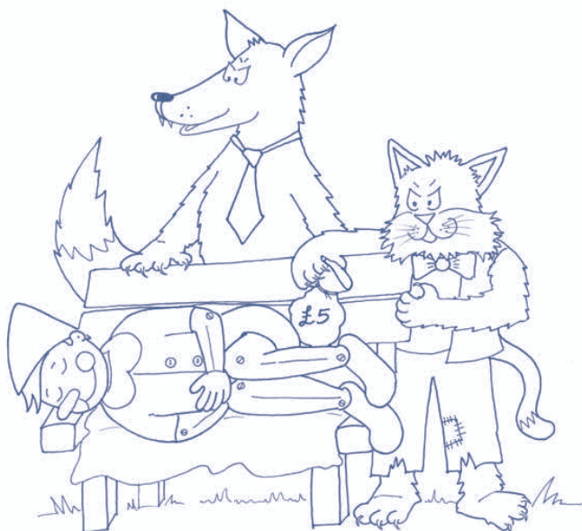
5. Il Gatto e la Volpe rubano le monete a Pinocchio. 5. The Cat and the Fox take Pinocchio's coins.