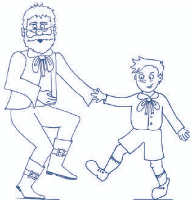
12. Pinocchio finalmente diventa un bambino vero. 12. Pinocchio becomes a real child!